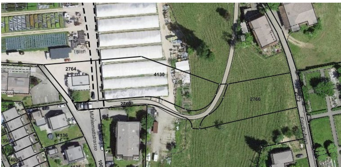
Orthofoto mit Moosmattweg