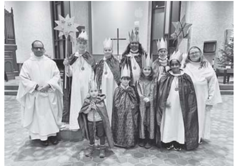
Sternsinger vom Januar 2022

Sie begegnen fremden Menschen, und bitten sie, Kindern und Jugendlichen auf der Welt zu helfen, im Namen Jesu, im Namen der Liebe. Sie bringen den Menschen den Segen, den Jesus Christus den Menschen bringt. Dafür haben wir 4 Treffen zur Vorbereitung der Sternsinger Aktion geplant. (Lieder und Gebete zu üben).