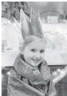
Unsere jüngste Sternsängerin vom Januar 2022