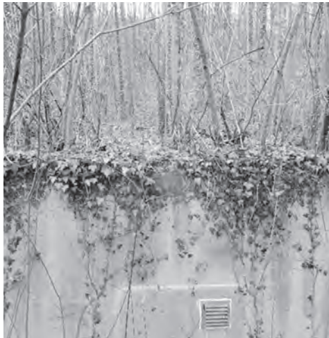
Sträucher auf der Reservoir Decke – Beispiel

Zu einem späteren Zeitpunkt (ca. 2030 – 2035) werden wir noch die äusseren Abdichtungen über den Reservoir-Kammern erneuern.