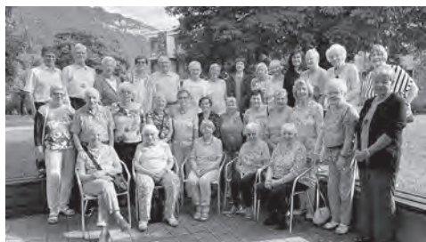
Seniorenwoche der Reformierten Kirch- gemeinde und er Pfarrei Dreikönig. Ein sonniger Gruss aus Interlaken.