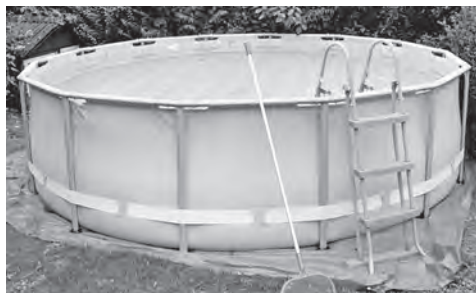
Mobil aufstellbarer Pool im Garten

Die Füllung hat bis Ende Mai zu erfolgen.