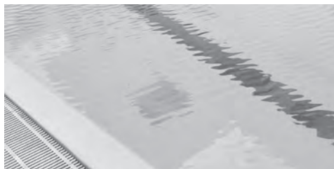
Fest installiertes Schwimmbecken

Das vorliegende Merkblatt richtet sich an Inhaber von privaten Schwimmbecken und von mobil aufstellbaren Pools. Gezeigt sind die Grundsätze zum umweltgerechten Umgang mit Becken-, Pool- und Reinigungswasser.