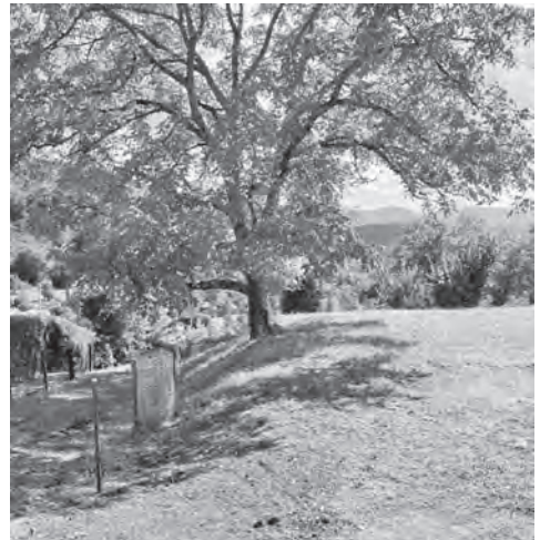
Nussbaum auf der Reservoir-Decke Pool