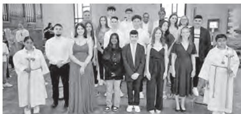
Firmanden 2023, Gruppe 1