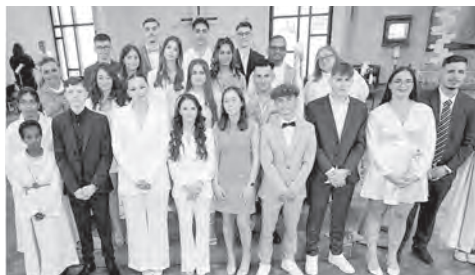
Firmanden 2023, Gruppe 2