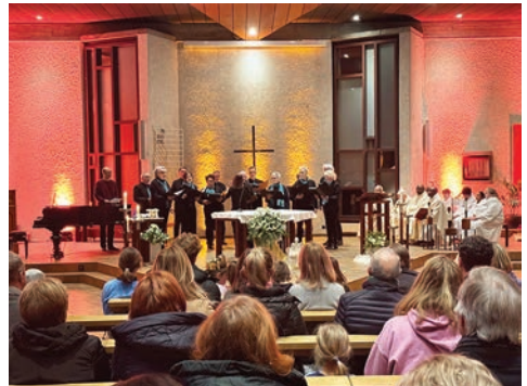
Eucharistiefeier begleitet vom Gospelchor Dreikönig