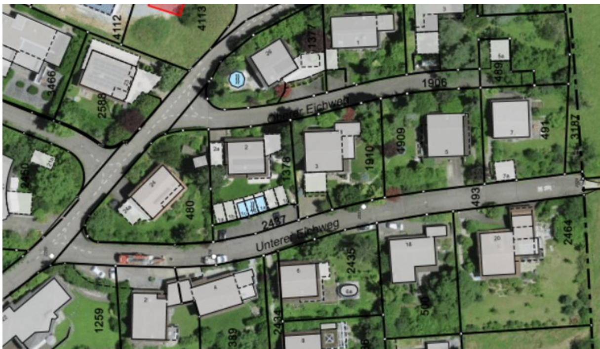
Orthofoto zum Gebiet der geplanten Wasserleitung